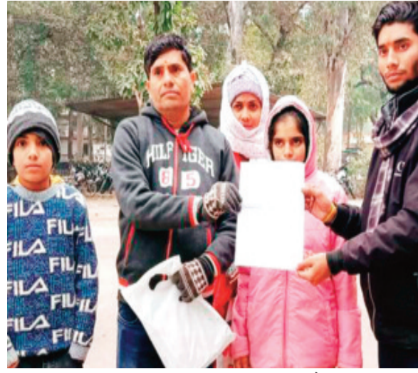
हरिभूमि न्यूज़ ललितपुर